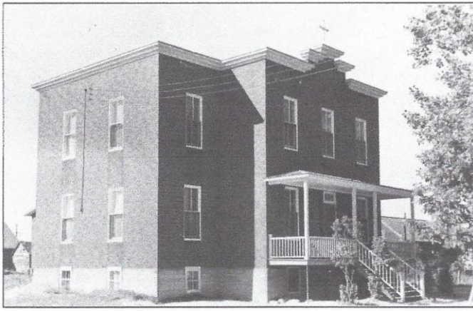
Le Couvent, dirigé par les Soeurs de l'Assomption de la Sainte Vierge, après les travaux de réfection et d'agrandissement réalisés en 1939.