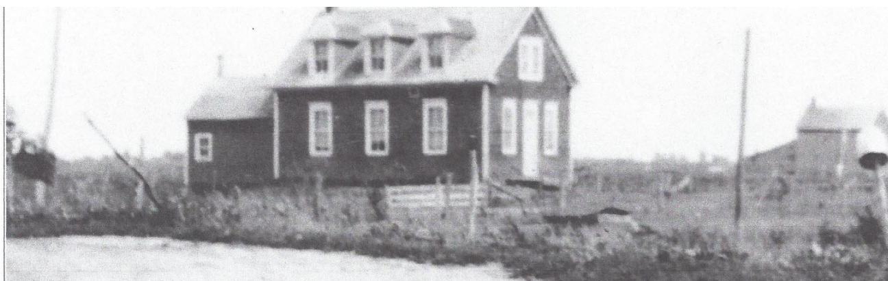
Première école du rang d'En-Bas, face à la route du Petit-Montréal

village et paroisse. En 1931, les habitants du Petit-Neuf, de plus en plus nombreux et dont les enfants fréquentent le Couvent au village, demandent leur propre école. Le projet traîne en longueur. Il faudra attendre 1933 et la formation de deux conseils scolaires séparés, village et paroisse, pour que le conseil scolaire de la paroisse autorise la construction d'une école dans le Petit-Neuf.